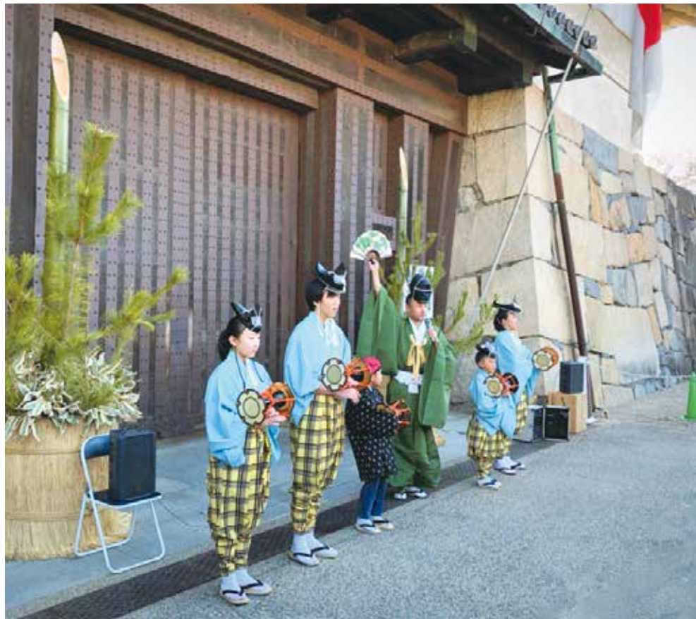
新年 開門前の名古屋城